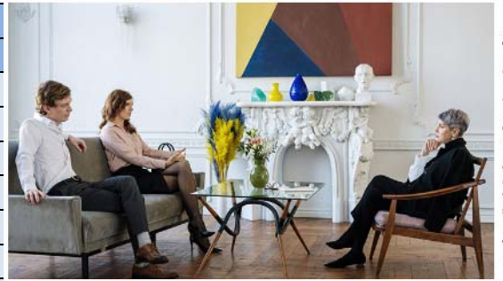
访谈演讲现场制作