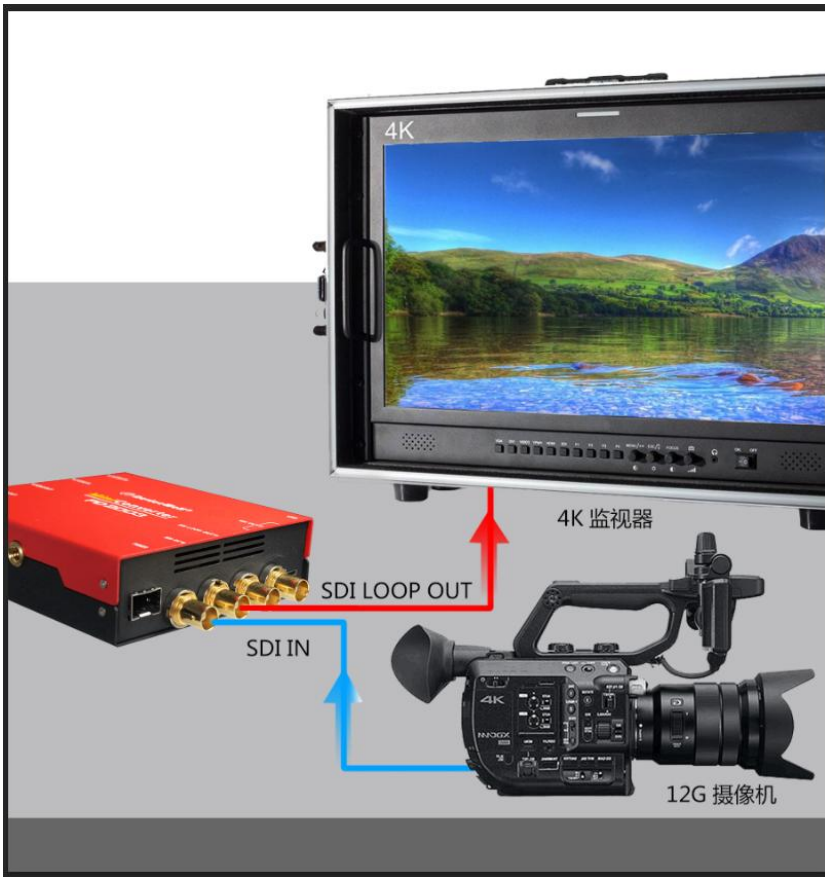
NO. 2 SDI 进 SDI 环出