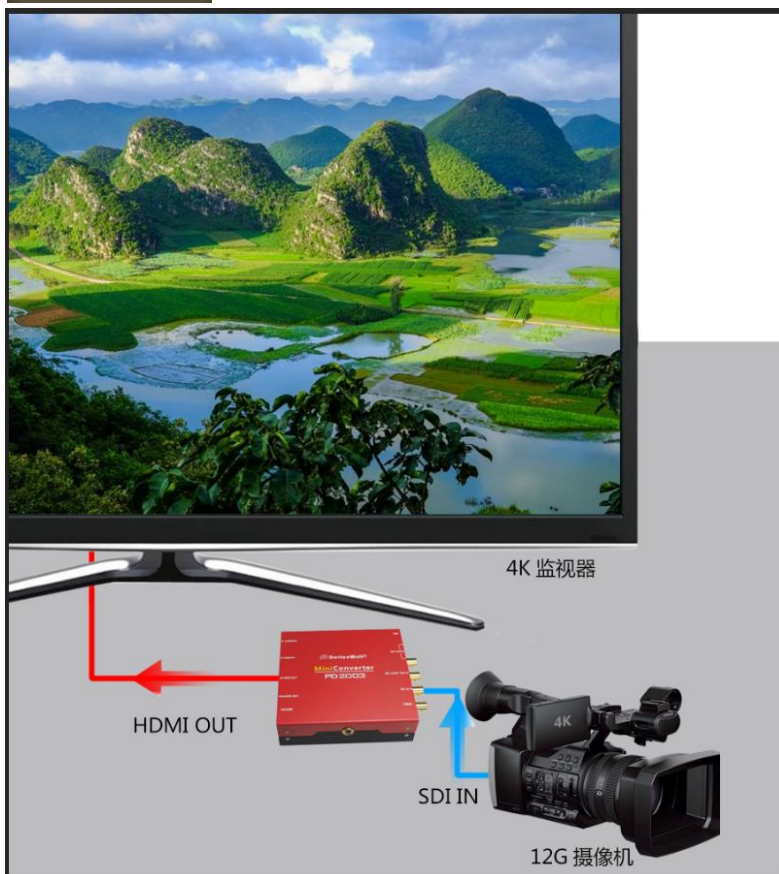
NO. 1 SDI 进 HDMI 输出