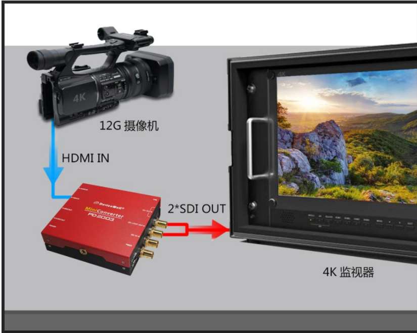
NO. 3 HDMI 进 2*SDI 输出